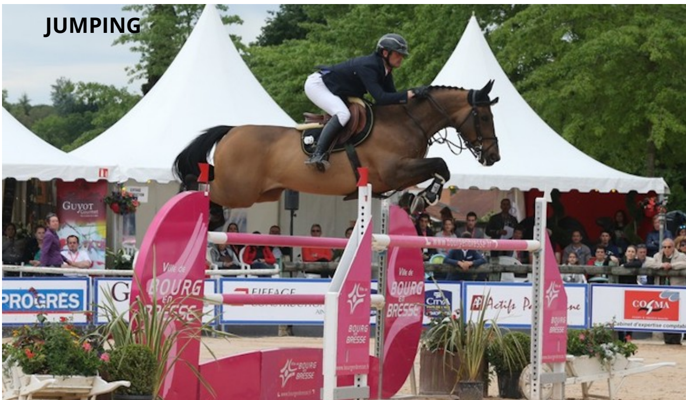
( http://www.grandprix-replay.com/modal-popup/1/6229/1/16N289_0238.jpg )