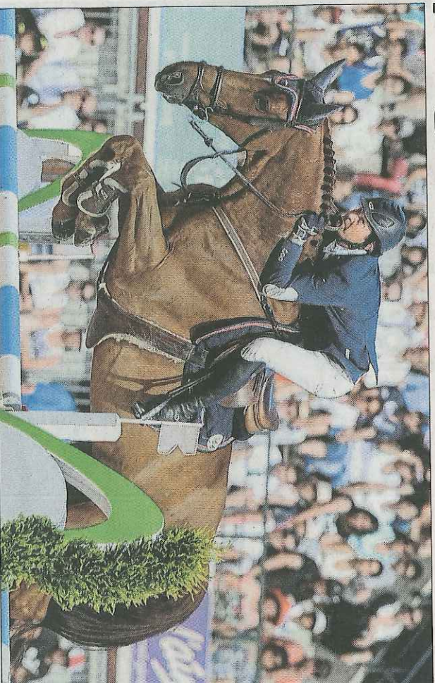
■ Les meilleurs cavaliers sont encore présents cette année.